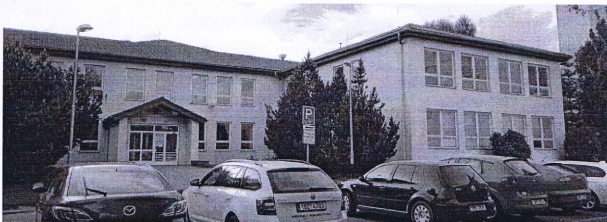
Obr. 1. MŠ, ZŠ a SŠ Vyškov, Sídliště Osvobození 681/55, pohled z jihovýchodní strany.